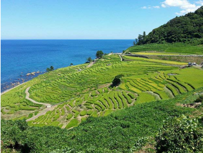
輪島市是日本知名稻米產區，也是重要農業遺產

第二個案例是位於石川縣的輪島市。相較於林業盛行的川上村，石川縣的的產業活動是以農業為主。因此，這個地方的地域振興協力隊主要的任務便是協助在地的農事工作。除了生產外，協力隊也會與社區居民共同討論如何販售森林裡面的野菜、企劃商業行銷、並支持系統的建立等等。